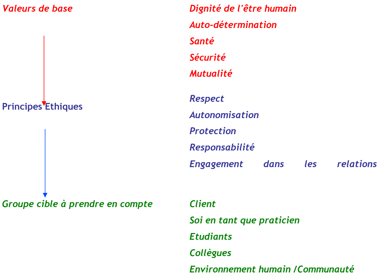
Fig. 1. Synthèse du corps du Code Éthique : trois niveaux d'analyse pour une pratique éthique.